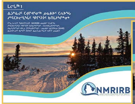
ᐱᓄᐱᓐᓴᐅᓐ 1: ᐱᓄᐱᓐᓴᐅᓐ ᐱᓄᐱᓐᓴᐅᓐ