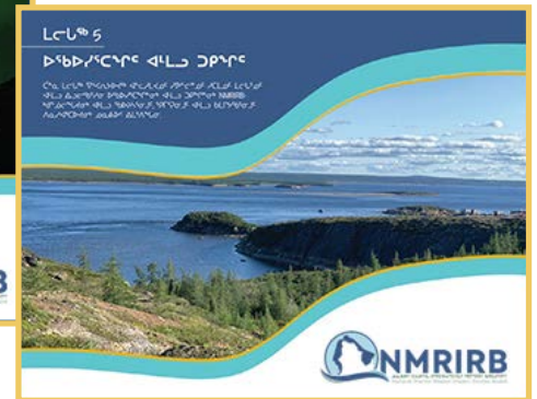
ᐱᓄᐱᓐᓴᐅᓐ 5: ᐱᓄᐱᓐᓴᐅᓐ ᐱᓄᐱᓐᓴᐅᓐ